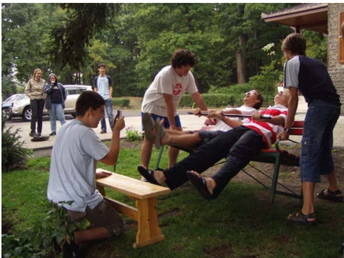
Néha kicsit örülten...