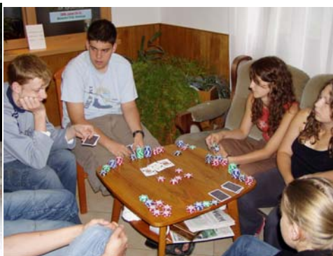
Ossza már!!! Ossza már!!!