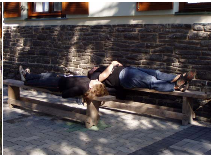
...és néha kicsit punnyadva