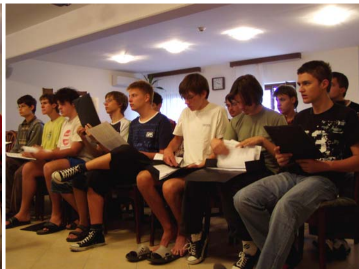
Szólampróbán az ALT és a BASSZUS