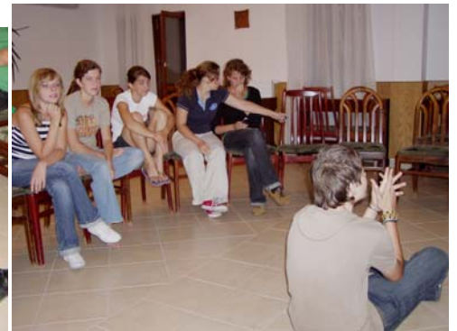
Véres küzdelem... a „puszicsata” képekben