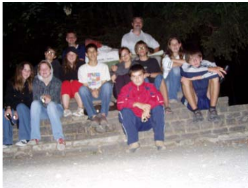
Éjszakai túra a Kékesre