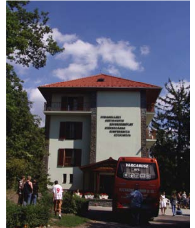
A felújított üdülő épülete

Remélem egy év múlva megint összejön valami hasonló...=)